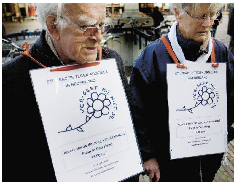
Deelnemers aan de ‘Stilteactie tegen armoede in Nederland’ die iedere maand plaatsvindt bij de Tweede Kamer.